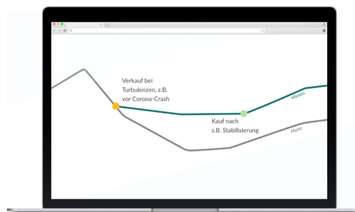
Schematische Darstellung der Funktionsweise des aktiven Managements.