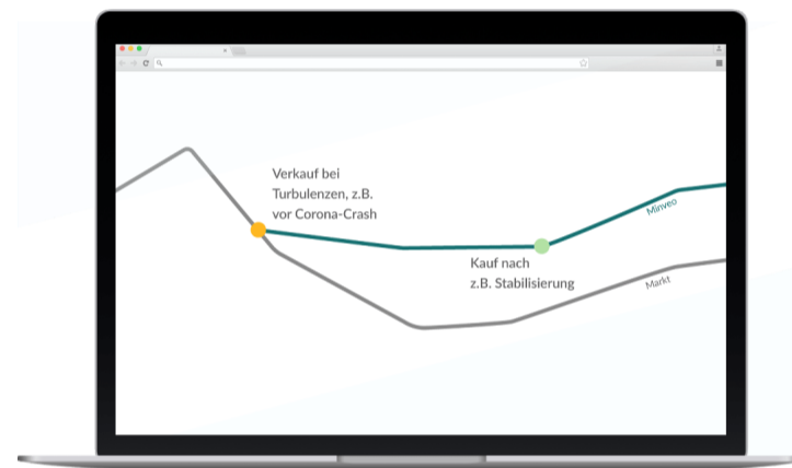
Schematische Darstellung der Funktionsweise des aktiven Managements.